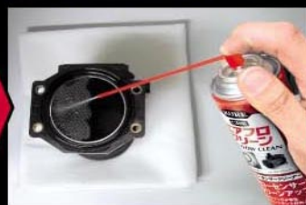
③ユニットとセンサーにエアフロクリーンを適量スプレーします。