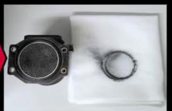
④スプレーするだけで汚れを簡単に落とします。