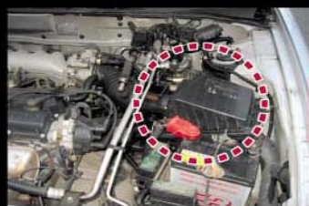
①エアクリーナーカバーに付いているエアフローセンサーユニット。