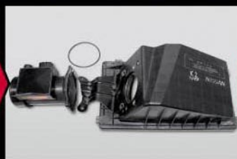
②エアクリーナーカバーからエアフローセンサーユニットを取り外します。