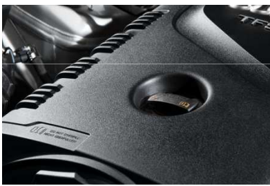
プラスチックパーツ