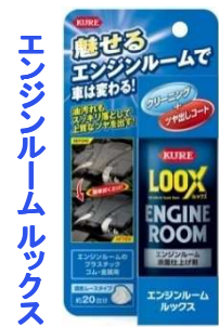
エンジンルームルックス