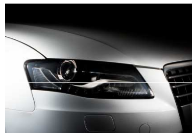
クリアなヘッドライト