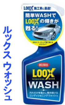
ルックスウォッシュ